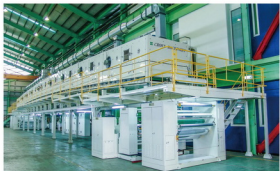
▲樺欣機械設計製造的高速及精密塗佈設備，為各國知名品牌大廠採用，圖為 BOPP 膠帶塗佈機。

和 BOPP 膜的義大利 Vibac Group，計畫斥資 6,000 萬歐元在塞爾維亞興建占地面積六萬平方公尺的新廠房。Vibac Group 的總裁和經營團隊，經過全方位的市場調查，主動接洽樺欣公司，經多次以視訊會議的方式，與樺欣機械深度研討和議價。